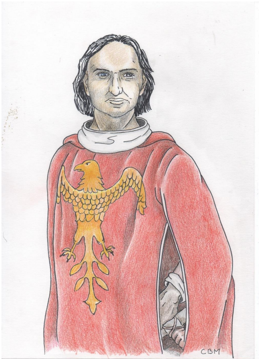
Jean de Vienne

L’armée royale française réagit aussitôt, mais elle ne connut pas que des victoires. Elle fut battue, par exemple, à la bataille de Brignais, au sud de Lyon, en 1362. Le connétable Jacques de Bourbon trouva la mort au cours de cet affrontement. De nombreux historiens pensent – sans qu’il existe de preuves formelles – que Jean de Vienne était à Brignais, parmi les nombreuses troupes viennoises qui participaient à la bataille. Il y aurait même été armé chevalier 11 .