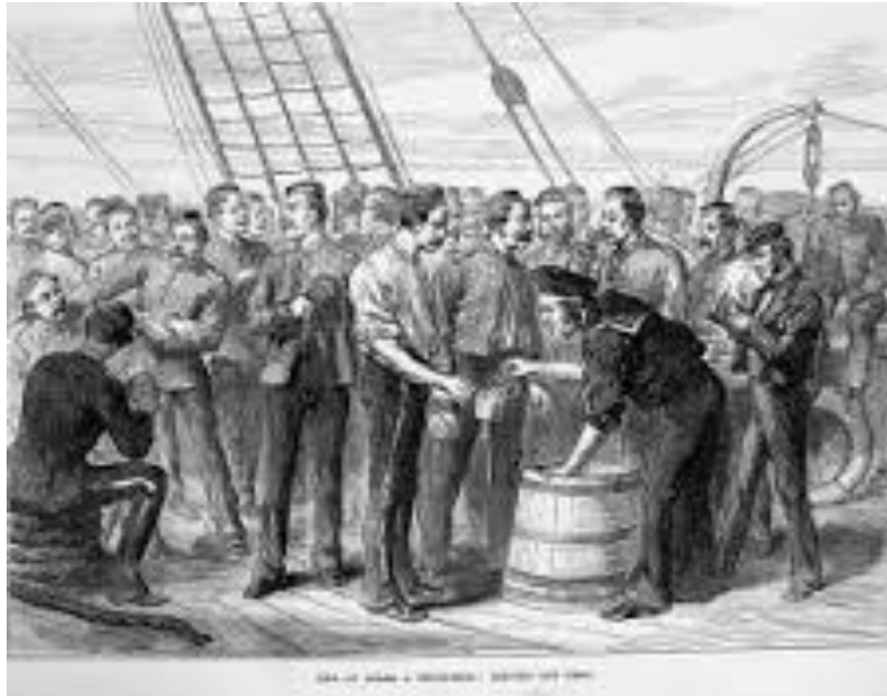
La distribution de grog à bord d'un navire de la Royal Navy

« un Noël arrosé » était une expérience très chaude. Presque tous les hommes à bord semblaient « dans un état d'intoxication bestiale ». Des hommes ivres s'entassaient au bas des écoutilles par lesquelles ils étaient tombés. Les batteries devenaient une image de l'enfer. Il n'était pas rare de trouver deux ou trois cadavres, lorsque les batteries étaient nettoyées le lendemain matin.