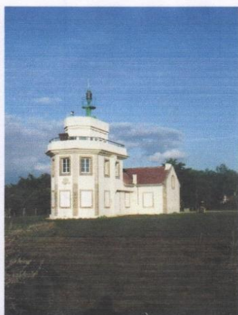
Le sémaphore de la Pointe St-Gildas (état actuel)

Le sémaphore de la Pointe Saint-Gildas, au sud de l'estuaire de la Loire (commune de Préfailles, Loire-Atlantique), est un ancien poste de surveillance côtière, aménagé aujourd'hui en musée maritime. Il présente de nombreux objets, maquettes et documents évoquant, d'une part les grands naufrages de l'estuaire et, d'autre part, le fonctionnement des sémaphores côtiers.